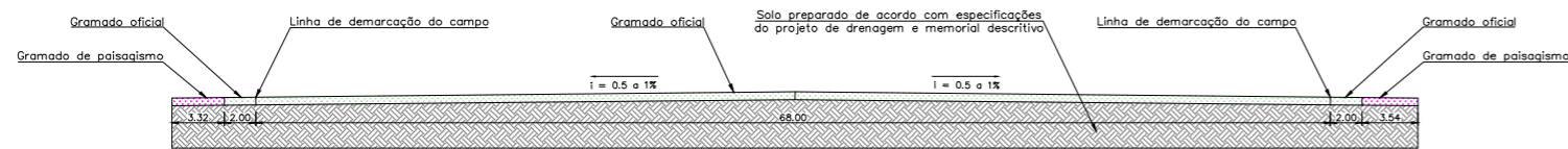
Corte AA – Gramado 1:500